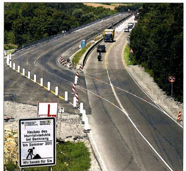
Startklar: Alles, auch die Markierung auf der Fahrbahn, ist für die Verkehrsfreigabe vorbereitet.